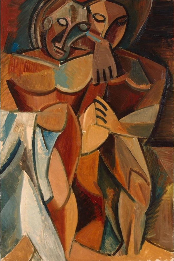
De Vriendschap – Pablo Picasso

Bijzonder die vertrouwelijke omgang tussen God en mens. Bijzonder om zo geportretteerd te worden. Die God die menselijke kanten heeft. En tegelijkertijd krijgen wij daar misschien ook goddelijke kanten mee. In dat gesprek gaat het over nabijheid, over elkaar nabij zijn.